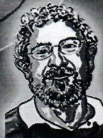
J. Michael Kosterlitz