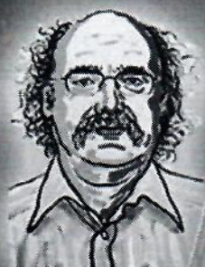
F. Duncan M. Haldane