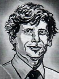
David J. Thouless